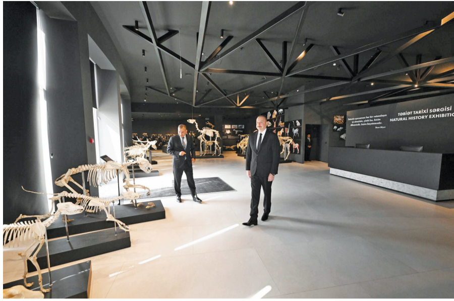
Əvvəlki səh. 1-də

Kompleksin Təbiət tarixi sərgi zalı eksponatların zənginliyi ilə böyük maraq doğurur. Sərginin "Böyük pişiklər", "Qobustan faunası", "Azərbaycanın vəhşi heyvanlarının ayaq izləri", "Azərbaycanın həşərat dünyası", "Kiçiklövlü heyvan skeletləri" guşələrində Azərbaycan və dünya faunasına aid vəhşi və ev