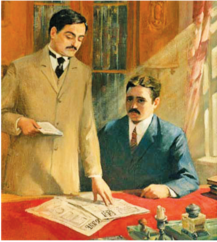
Sentyabrın 18-i Azərbaycan musiqi mədəniyyətinin inkişafında görkəmli yeri olan Üzeyir Hacıbəyli (1885–1948) və Müslüm Maqomayev (1885–1937) doğum günlərində.

Hər bir istedadın parlaması üçün çox zaman onun dünyaya göz açdığı və boya-başa çatdığı mühitin böyük təsiri, rolu olur. Eyni ildə, eyni gündə dünyaya göz açan Üzeyir Hacıbəyli və Müslüm Maqomayev də bu təsirli həyat yolunu seçmiş, mədəniyyətimizin tərəqqisi yolunda birgə addımlamışlar. Bir amal, bir məslək iki istedadı – böyük şəxsiyyəti həmişəlik yaxınlaşdırmış, əsl dost, qardaş eləmişdir.