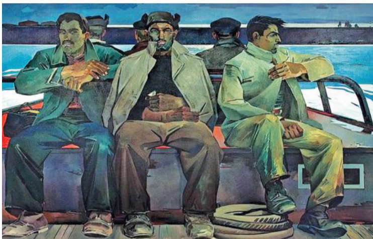
Uşaq yaddaşı iti olar deyiblər. Bakılıların "nöyü" dediyi "neft" kəlməsi işləniləndə ilk olaraq ağılıma indi müəllifini xatırlamadığım tünd-göy rəngli "Qara qızıl" adlı hekayə kitabı gəlir. O zaman hələ məktəbli deyildim və anam mənə bu kitabdan neftçilər, Neft Daşları, Bakının "qara qızıl"ı haqqında hekayələr oxumuşdu...