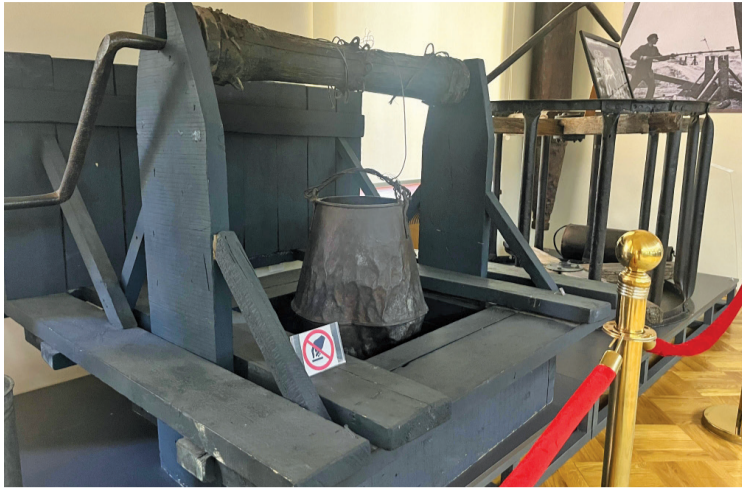
Əvvəlki səh. 1-də

Əlamətdar gün ərəfəsində muzeydə neft sənayesinin tarixinə səyahət elədik.