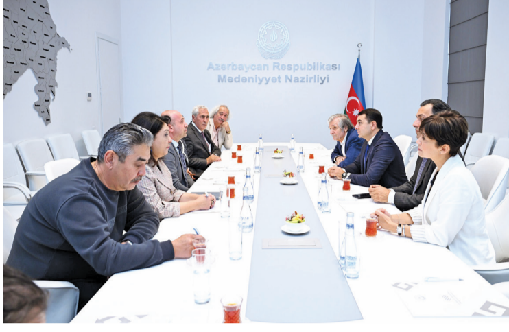
layihə çərçivəsində Xəzəryanı və digər ölkələrdən rəssamlar, kuratorlar və ekspertlərin bir araya gəlməsi diqqətəlayiq hadisədir.

Mədəniyyət Nazirliyində “Xəzər” Biennalesinin iştirakçıları ilə görüş