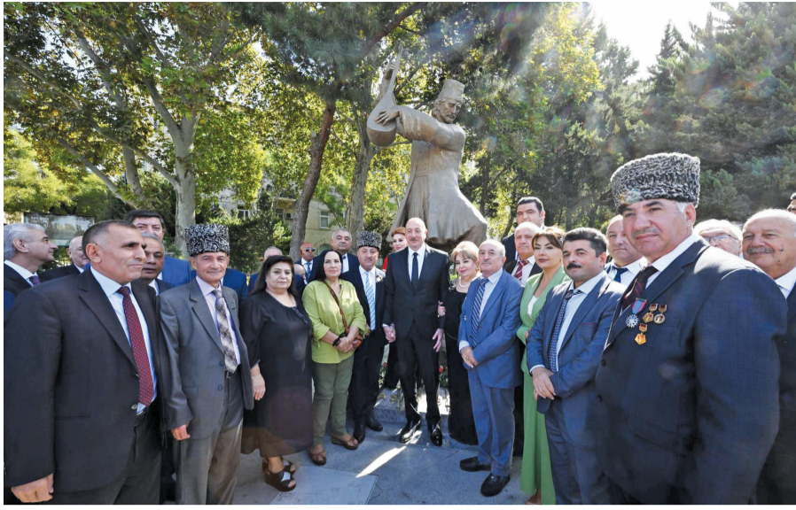
əvvəlki səh. 1-də