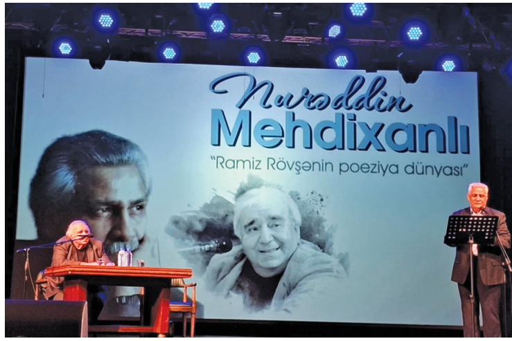
"Şirin-şirin yuxudaydıq, Bir zalım oyatdı bizi. Anaların qucağından Bu dünyaya atdı bizi"

deyən şair taleyinə gülümsəməkdən başqa çarəsi olmayan adamların görünməyən alovuna sanki su səpdi.