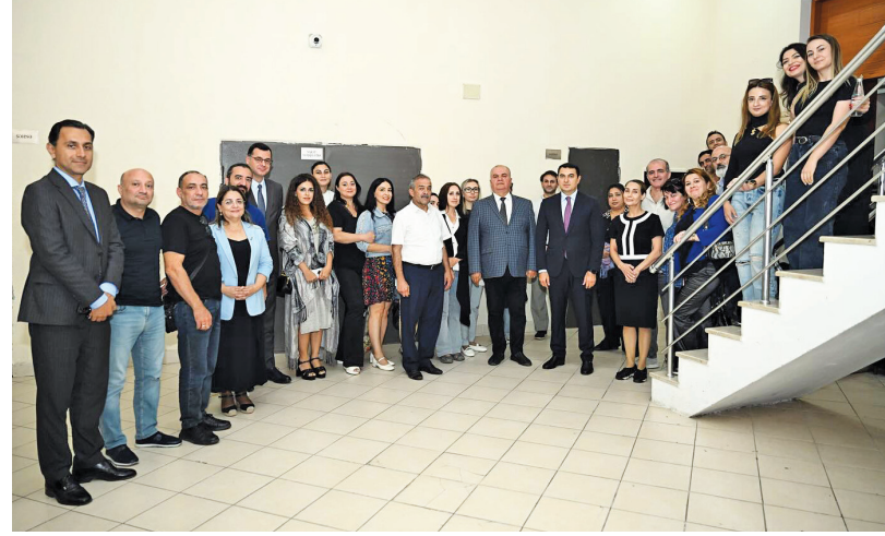
Teatrın yaradıcı heyət üzvləri də çıxış edərək fikirlərini bölüşüb, arzu və təkliflərini diqqətə çatdırıblar.

Direktor fəaliyyətlərində Mədəniyyət Nazirliyinin diqqət və qayğısını daim hiss etdiklərini vurğulayıb. O, ölkədəki digər dörd kukla teatrı (Gəncə, Salyan, Qax, Naxçıvan) üçün mərkəz funksiyasını da yerinə yetirən Azərbaycan Dövlət Kukla Teatrının statusu ilə bağlı məsələni qeyd edib, eləcə də ömrü şırma arxasında keçən kuklaçılıqların əməyinin qiymətləndirilməsini arzuladıqlarını diqqətə çatdırıb. Teatrın mütəmadi şəkildə yüksək kateqoriyalı beynəlxalq festivallarda iştirak etdiyini deyən direktor vaxtilə ölkəmizdə keçirilən "Cırdan" Bakı Beynəlxalq Kukla Teatrları Festivali formatında yeni bir layihənin həyata keçirilməsinin əhəmiyyətli olduğunu bildirib.