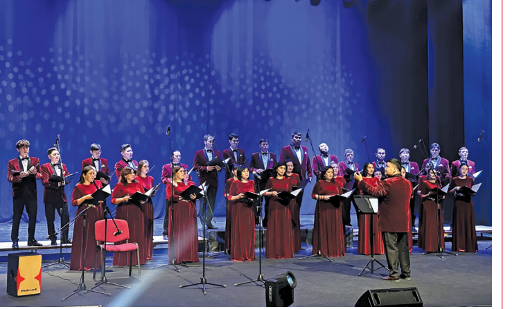
"Çölün ruhu" adlı xor musiqisi konserti Türk Mədəniyyəti və İrsi Fondunun təşkilatçılığı ilə Fikrət Əmirov adına Gəncə Dövlət Filarmoniyasında da təqdim edilib.