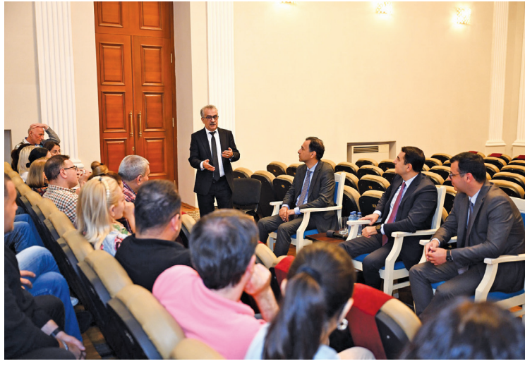
Mədəniyyət naziri Adil Kərimli oktyabrın 10-da Azərbaycan Dövlət Kukla Teatrında olub, kollektivlə görüşüb söhbət edib.

93 illik zəngin keçmişə malik, milli kuklaçılıq ənənələrini layiqincə yaşadan sənət ocağı haqqında söz açan nazir dövlət teatr müəssisələri ilə ilk görüşün buradan başlamasının təsadüfi olmadığını deyib. Bildirilib ki, teatr tamaşa-plan göstəriciləri, repertuar siyasəti, daxili və xarici qastrollar, beynəlxalq festivallarda iştirak baxımından öz fəaliyyəti ilə seçilir. Qarşıda duran məqsəd və vəzifələrdən danışan Adil Kərimli yeni dövrün çağırışlarının teatrların fəaliyyətində nəzərə alınmasının əhəmiyyətini qeyd