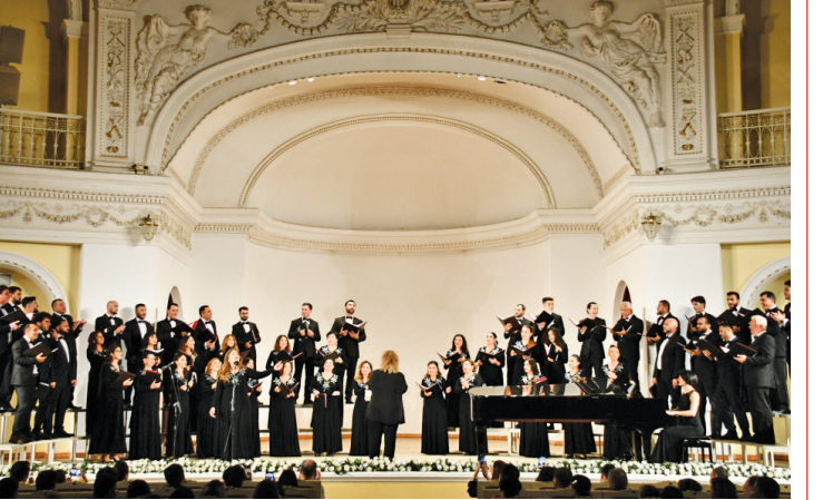
Müslüm Maqomayev adına Azərbaycan Dövlət Akademik Filarmoniyasının səhnəsində Məhəmməd Füzulinin 530 illiyinə həsr olunmuş "Füzuli günləri" layihəsi çərçivəsində "Çölün ruhu" adlı xor musiqisi konserti keçirilib. Konsert oktyabrın 10-da Türk Mədəniyyəti və İrsi Fondunun dəstəyi ilə gerçəkləşib.

Konsertdən əvvəl Türk Mədəniyyəti və İrsi Fondunun prezidenti Aktotı Raimkulova çıxış edərək dəhşət Azərbaycan şairi və mütəfəkkiri Məhəmməd Füzulinin yubileyinə daha bir sənət təhffəsi verməkdən məmnun olduqlarını deyib.