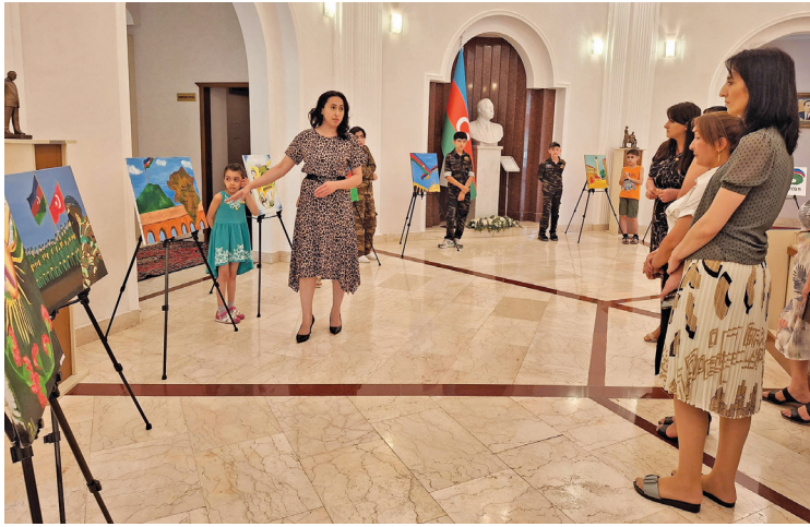
Əvvəlki səh. 1-də

Quba Tarix-Diyarşünaslıq Muzeyində Silahlı Qüvvələr Günü-nə həsr olunmuş tədbirdə çıxış edənlər 1918-ci ilin 26 iyununda Azərbaycan Xalq Cümhuriyyəti Nazirlər Şurasının qərarı ilə ilk milli diviziyanın yaradılması ilə başlanan tarixdən söz açıblar. Qeyd olunub ki, bu gün müzəffər Ordumuz xalqımızın qürur mənbəyidir. Qonaqlar muzeydə əlamətdar günə həsr olunmuş sərgi ilə tanış olublar.