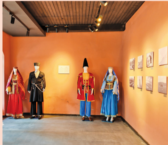
Xanlıq Muxtar karvansarasındakı bu sərgi avqustun 12-dək davam edəcək.

Qeyd edək ki, eyni məkanda "Qarabağ tarixi fotoları" adlı sərgi də təşkil edilib. Sərgidə 1880-1970-ci illərdə Qarabağda azərbaycanlı fotoqraflarla yanaşı, ölkəmizdə yaşamış rus, yehudi əsilli fotoqraflar tərəfindən çəkilmiş nadir şəkillər yer alır. Fotolar "İçərişəhər" Dövlət Tarix-Memarlıq Qoruğu İdarəsinin Muzey Mərkəzinin fonduna məxsusdur.